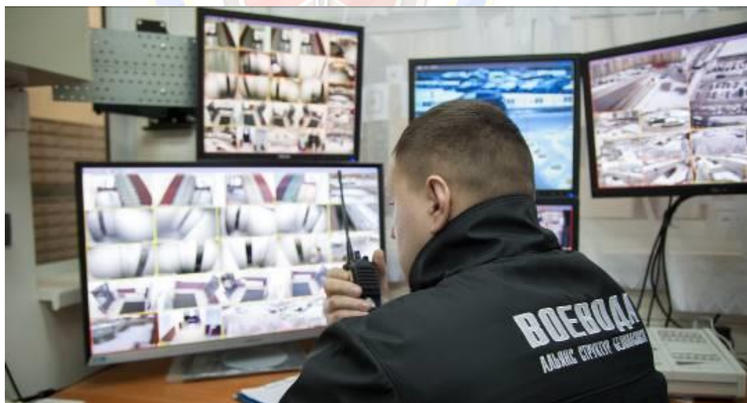
Пульт централизованного наблюдения