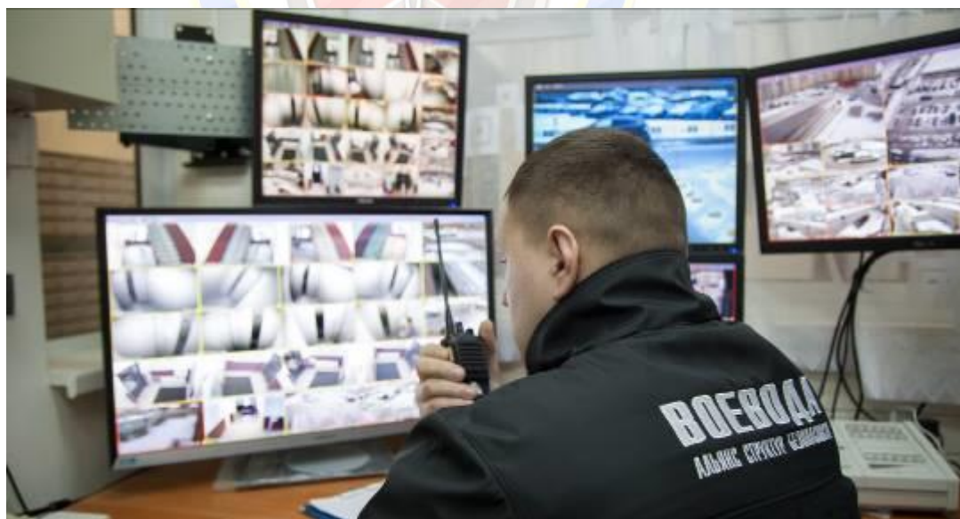
Пульт централизованного наблюдения