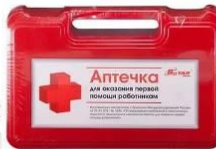
аптечка (на КПП)