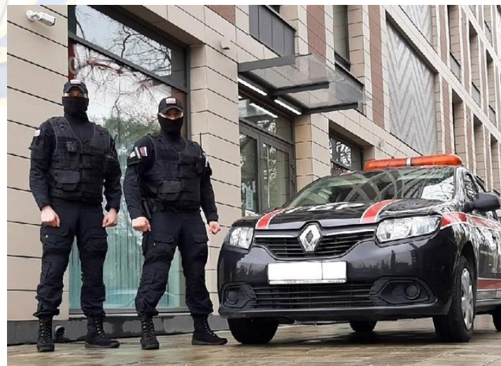
Группа быстрого реагирования